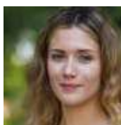
Vicepresidente del Consiglio Comunale

consigliere.costa@comune. sangiorgiodellepertiche.pd.it