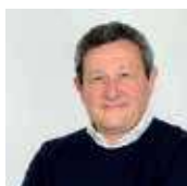
Presidente del Consiglio Comunale