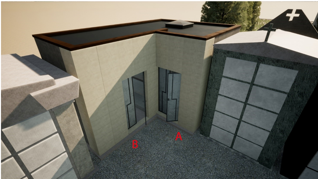
6) VISTA DELLE CAPPELLE MORTUARIE A e B

Caregnato Angelo Responsabile Settore II "Servizi alla persona" Sottoscritto digitalmente ai sensi dell'articolo 21 del D.Lgs. n. 82/2005 e ss.mm.ii