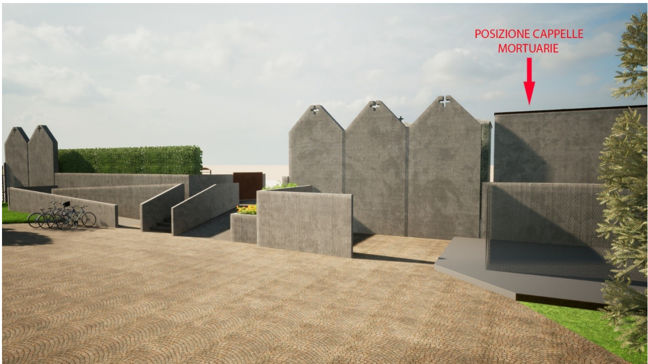
2) VISTA DELL'INGRESSO DEL CIMITERO CON INDICATA LA POSIZIONE DELLE CAPPELLE MORTUARIE