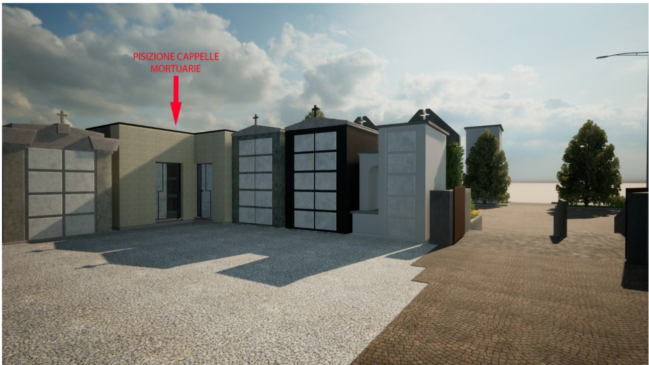
4) VISTA INTERNA DEL CIMITERO CON INDICATA LA POSIZIONE DELLE CAPPELLE MORTUARIE