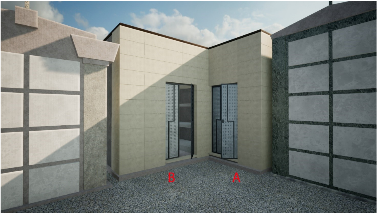
5) VISTA DELLE CAPPELLE MORTUARIE A e B