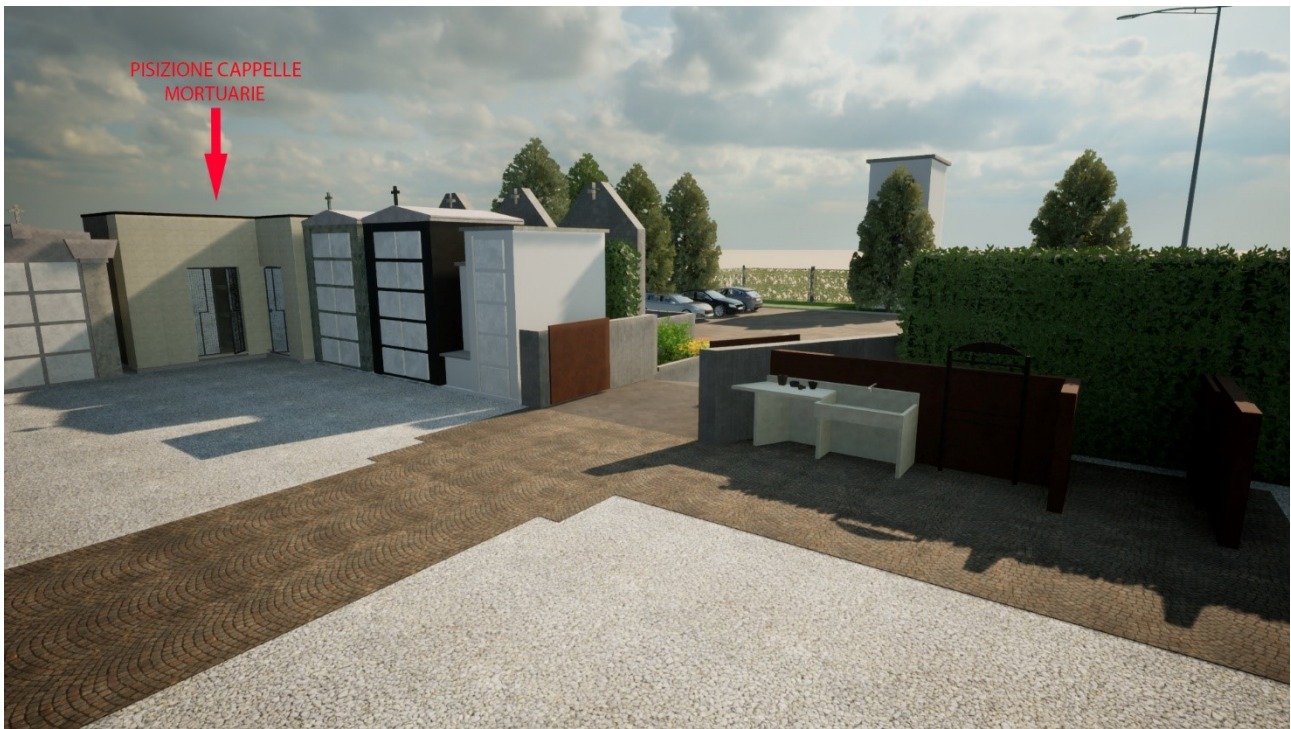
3) VISTA INTERNA DEL CIMITERO CON INDICATA LA POSIZIONE DELLE CAPPELLE MORTUARIE