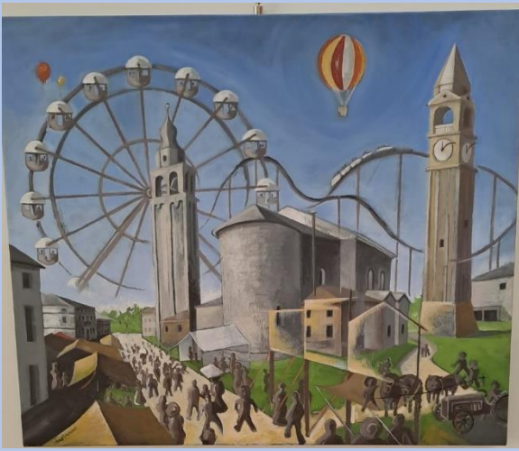
Autore: Dorella Alessandro Titolo: Fiera di Arsego: ieri e oggi

Partendo da una foto d'epoca ho ritratto lo scorcio della chiesa e della via principale di Arsego, sovrapponendo un'altra visuale a distanza di tempo (vedi campanile a dx e aggiunte in terra d'ombra) e riempiendo lo sfondo con le giostre di oggi. Una tradizione, quella della Fiera, che prosegue nel tempo.