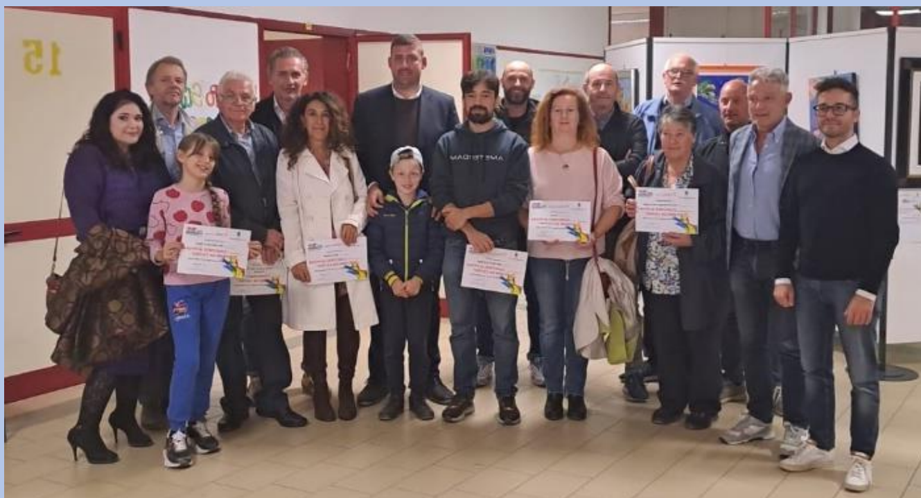
Foto di gruppo con l'Amministrazione Comunale di San Giorgio delle Pertiche, i concorrenti che hanno partecipato al Concorso di pittura 2023 " Giovanni da Cavino " e la giuria.