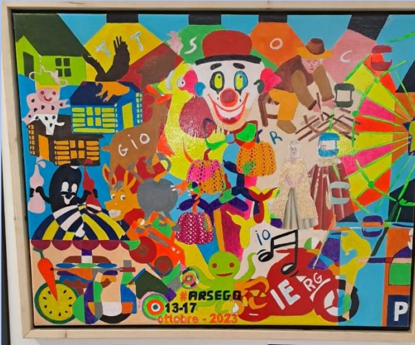
Autore: Costa Piergiorgio Titolo: I colori della Fiera

Un mix di oggetti e soggetti che in ordine "non casuale" compongono la parte gioiosa della Fiera di Arsego.