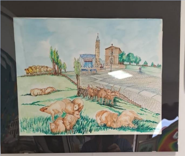
Autrice: Iaccarino Elvira Titolo: Relax