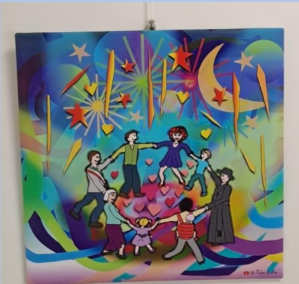
Autrice: Longo Fabiola Titolo: Girotondo al chiaro di stelle

Tramite questa illustrazione voglio presentare quello che per me è l'essenza della tradizionale Fiera di Arsego: il momento di festa che porta un clima di grande allegria e divertimento in tutti i cuori di chi vi partecipa. Una festa ben riuscita che avviene solo grazie alla collaborazione delle maggiori autorità del paese con l'aiuto di tutte quelle persone di buon animo che operano silenziosamente attraverso il volontariato. Sotto un cielo stellato, coperto dalla miriade di fuochi artificiali super colorati, troviamo il sindaco, un nonnino, una giovane signora, un bambino, il parroco, un papà con il suo bebè nel marsupio, una piccola bambina, una nonna. Tutti si tengono per mano e formano un giocoso girotondo. I cuori al suo interno sono un simbolo del bene e del buono che c'è in ognuno di loro. "Tenendosi per mano" attraverso la condivisione e l'empatia tutti possono vivere un momento di gran divertimento, un'emozione che sarà di ricordo. L'immagine evoca "La danza" del pittore Matisse, sia per la posizione dei protagonisti, che dal punto di vista simbolico, quale espressione di un abbraccio universale, di armonia e felicità.