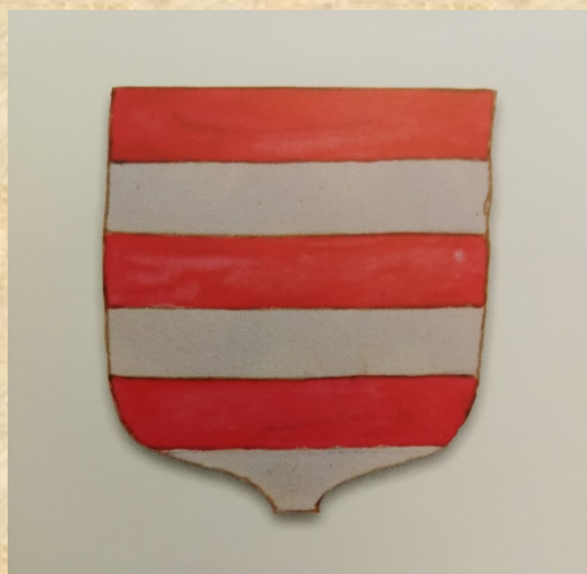
Stemma della famiglia Dalesmanini: BCP, cod. BP 1346